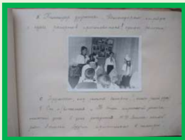
Альбом «Юные пионеры» 22 апреля 1967 года